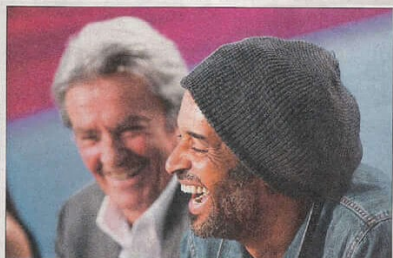
Yannick Noah. Un album en août, une tournée de stades en septembre... 2010 sera une grande année pour lui!

Patricia, astrologue: «Cette rupture est une épreuve karmique: elle ne pouvait pas échapper à son destin! Elle rencontre des gens