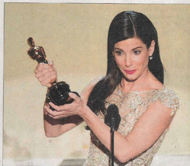
Sandra Bullock. Oscar, rupture, adoption... Le mois de mars a été plutôt violent émotionnellement parlant pour elle.