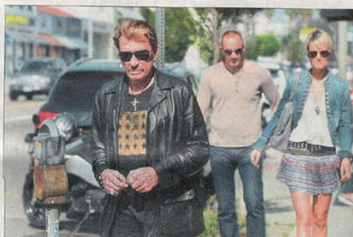
Johnny Hallyday, l'idole des jeunes parviendra-t-elle à surmonter ses problèmes de santé? Laetitia veille...